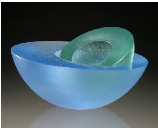
Heike Brachlow: Off Centre, 2004, cast glass, d 19 x h 10 cm

With just a few centimeters of thickness these cast works appear very dark. One of the main objectives of Brachlow's graduate work was to develop a process in which smaller amounts of clearly defined hues in various lighter values can be produced in kilns. She published her results so that other artists have access to them. The second focus of her graduate work was to develop a new group of works. This she created by selecting cubes of test colors, which Brachlow newly arranged in rows of test hues, and stacked in towers. Looking through the cubes, the overlapping effects lead to ever new mixtures of colors. These "ready-made" works of this Theme and Variation series consists of