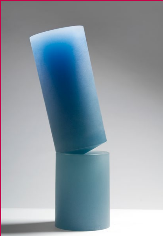
Heike Brachlow: Waiting V, 2008, cast glass, 2 elements, h 65 x w 17,5 x d 17,5 cm, 2 variations, photo: Ester Segarra