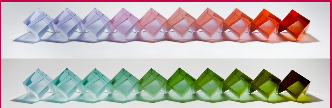
Heike Brachlow: Theme and Variations I, 2009, line blend, Bullseye glass doped with neodymium, cerium, and titanium oxides in the ratio 2:1:1, photo: in incandescent (top) and fluorescent light by Ester Segarra,

One problem with casting techniques is that color glass is actually made for glassblowing and is embedded between two thin layers of colorless glass.