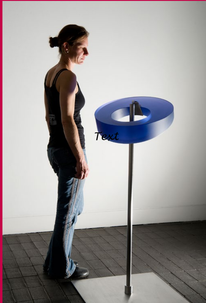
Heike Brachlow: Avis III, Six Impossible Things Series, 2011, cast glass, steel, stainless steel, d 48 cm

Reisen führten Brachlow durch die ganze Welt. In Neuseeland lernte sie im Jahr 2000 eine Studioglaswerkstatt kennen. Von der Ausstrahlung transparenter Glasfarben im durchscheinenden Licht war sie fasziniert und begann, das Glasblasen zu erlernen. Die Suche nach einer Hochschule endete in England. An der University of Wolverhampton befasste sie sich zunächst mit dem Glasblasen, entdeckte aber auch die Arbeit mit Formschmelztechniken, die ihren Interessen an geometrischen Formen und scharfen Kanten viel mehr entsprachen. Aus dieser Zeit stammen dickwandige Schalen, mal geblasen, mal formgeschmolzen und bisweilen ineinandergestellt. Diese Schalen eröffneten Brachlow zwei neue, grundlegende Perspektiven für das weitere Werk: Die subtilen Übergänge von Farbnuancen eines einzigen Farbtons bei formgeschmolzenem Glas entsprechend variierender Wandstärken von Lichthell bis fast ins