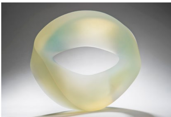
Heike Brachlow: Allusion, 2016, cast glass

The sculptures of Heike Brachlow appear to be solid and weightless at the same time. She has expanded the vocabulary of cast glass with her work and developed an outstanding independent language of forms in a continually more focused area of work. In the catalog of the exhibition Chaos Theory of 2016, she explains