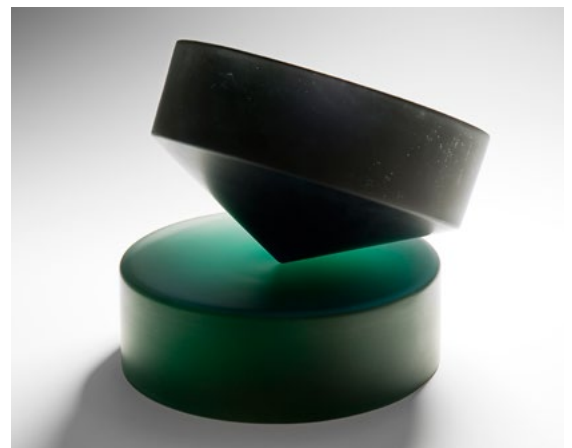
Heike Brachlow: On Reflection III, 2009, cast glass, d 29 x h 29 cm, photo: Ester Segarra