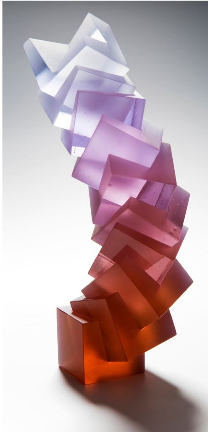
Heike Brachlow: Theme and Variations I, 2009, polychromatic cast glass, each cube: 6x6x6 cm, the individual cubes are coloured with the same mixture of oxides, using increasing amounts; the glass contains neodymium oxide, which causes it to change colour in different types of light, most obviously between incandescent (pink) and fluorescent light (green), photo: Ester Segarra

B ewegung und Transformation sind die zentralen Begriffe zur Erschließung des Werks von Heike Brachlow. Weitere sind: Farbe, die Schönheit geometrischer Grundformen und ihrer Ableitungen sowie ein spielerischer Zugang, der die Betrachter zu Akteuren macht. Es geht um den Übergang von einem Zustand zu einem anderen. Klare, transparente Farben verändern mit der Wandstärke der formgeschmolzenen Arbeiten ihren Farbton. Polychromatisch gefärbtes Glas wechselt bei der Nutzung verschiedener Lichtquellen völlig seine Farbe, als hätte man unterschiedliche Objekte vor sich. Viele von Brachlows Arbeiten können durch die Betrachter in Bewegung versetzt werden: Sie pendeln hin und her, sie schwingen vor und zurück, drehen sich um die eigene Achse, dass einem Angst und Bange wird um die physische Integrität der anscheinend kurz vor dem Absturz oder Zusammenprall befindlichen Kunstwerke. Oft kommen sie in einer anderen Position zur Ruhe, als der, aus der sie aktiviert wurden. Bauelemente können zu Farbreihen oder Türmen angeordnet werden: Bei den wechselnden Zusammenstellungen entstehen immer wieder neue Überlappungen der einzelnen Farben und damit in der Durchsicht neue Farbmischungen. So wie die Rolle des üblicherweise passiven Betrachters in einen Akteur überführt ist, um die ganze Vielschichtigkeit der Arbeiten erlebbar werden zu lassen, ist auch Brachlows eigene Rolle mehrschichtig. Sie